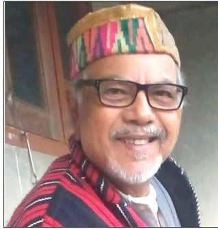
কামনা কৰাৰ লগতে শোক সন্তপ্ত পৰিয়ালবৰ্গলৈ গভীৰ সমবেদনা জনায়।