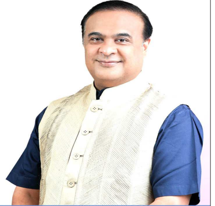
ড° হিমন্ত বিশ্ব শৰ্মা মুখ্যমন্ত্ৰী, অসম

উদ্যমিতাৰ দিশত আগুৱাই যাবলৈ আত্মসহায়ক গোটৰ প্ৰতিগৰাকী অৰ্হতাসম্পন্ন মহিলালৈ প্ৰত্যক্ষ লাভালাভ হস্তান্তৰ প্ৰক্ৰিয়াৰ যোগেদি